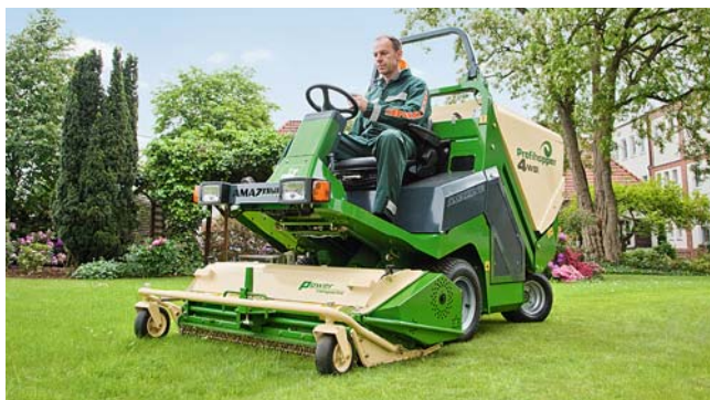
Zelfrijder Profihopper 4WDi

Afbeeldingen, inhoud en informatie over technische gegevens zijn niet bindend! Afbeeldingen van machines kunnen afwijken door specifieke verkeersvoorschriften per land.