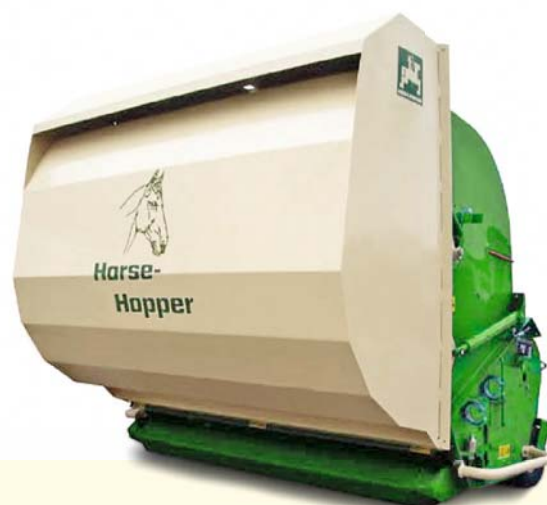
➕ Horse-Hopper HH 1800 1,8 m werkbreedte, 1.800 l inhoud opvangbak

Het gemaaide gras kan men volgens de Höfkens, het beste op een centrale hoop storten. “Wij maken elk jaar weer een nieuwe stapel. Na een tot twee jaar, wanneer het mengsel van maaisel en mest compleet verrot en gecomponeerd is, kunnen we dat materiaal weer als meststof verspreiden. Door de warmte, die in de loop van de tijd in de stapel ontstaat, kunnen de eieren van de wormen geen schade meer aanrichten.”