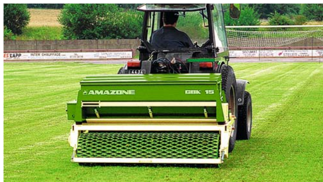
Grasbreedzaai combinatie GBK