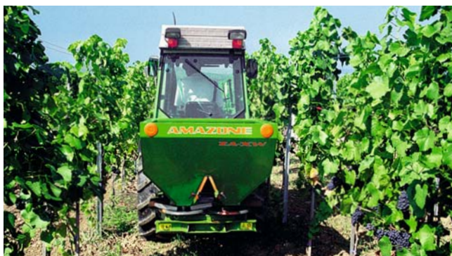
Tweeschijvenstrooier ZA-XW, 500 l inhoud