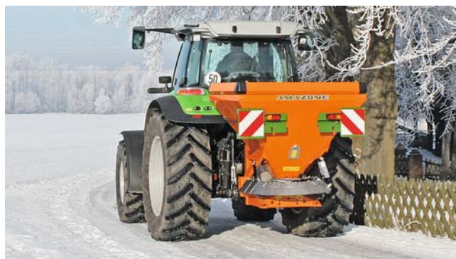
Winterdienststrooier E+S, 300-1.000 l inhoud